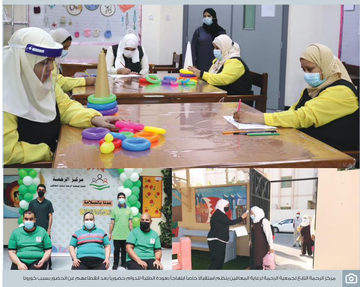
مركز الرحمة للثقافة لجمعية الرحمة لرعاية المعاقين بظلم استقبالا خاصا بلهاجا بعودة الطلبة للدوام بحضورها بعد القطاعهم عن الحضور بسبب كورونا

فمن سيسمهم معارضة مرة أخرى قبل بالخيانة وقام بأخطر من ذلك فإنه قد سق لها.