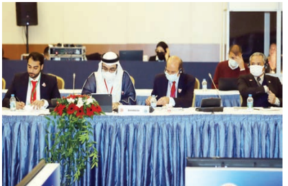
ضمن مشاركتها في اجتماع مكتب الجمعية البرلمانية الآسيوية

بدره قال النائب الأول لرئيسة مجلس النواب عبداللثبي سلمان إننا نأمل أن يكون التعاون مع الحكومة فعليا وليس شكليا مشيرا إلى أن ردود الحكومة مازالت إنشائية، وانتقد تجاهل بعض الوزراء قائلا: إنه يحاول أن يتواصل مع ثلاثة وزراء منذ حوالي شهر من دون رد، مضافا أنه إذا كان هذا المجلس له احترام فعلى هؤلاء الوزراء أن يحترموا ممتلي الشعب. وأضاف أن من قايه على البلد يتعاون مع نواب البلد، ولا بد من أن يكون هناك خطط حقيقية في الملف الإسكاني، بالإضافة إلى ضرورة توظيف الشباب خريجي الطب لافتا إلى أن العقود المؤقتة تكون للمواطنين بينما يحصل الأجانب على كل الامتيازات. وتابع قائلا: «ما تدب المواطن أن يفقد برنامجنا مثل