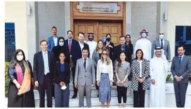
لقاء الوطنية لحقوق الإنسان بعدد من موظفي مجلس النواب والشيوخ الأمريكي.