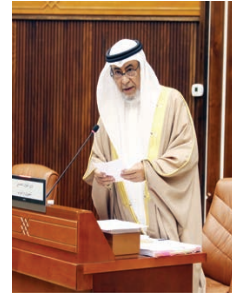
○ وزير مجلسي الشورى والتواب