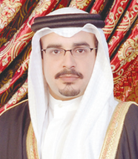
سمو ولي العهد رئيس الوزراء

صدر عن صاحب السمو الملكي الأمير سلمان بن حمد آل خليفة ولي العهد رئيس مجلس الوزراء حفظه الله القرار رقم (54) لسنة 2021 بتعديل بعض أحكام اللائحة التنفيذية لقانون الخدمة المدنية الصادر بالمرسوم رقم (48) لسنة 2010 الصادرة بالقرار رقم (51) لسنة 2012. ونص القرار على أن يكون النوب لمدة سنة واحدة قابلة للتجديد لمدة أقصاها ثلاث سنوات، واستثناءً من ذلك يجوز تجديد النوب لمدة لا تزيد مجموعها عن ثلاثة أشهر هذه المدة؛ وذلك لإداء مهام الخدمات المشتركة. وأكد القرار أنه يجوز تطبيق سياسة العمل عن بعد خارج مكان العمل، وذلك في الوظائف التي يمكن تأدية مهامها عن بعد، وفقاً لما تقرره السلطة المختصة بعد موافقة الجواز. وأن تطبيق سياسة العمل عن بعد في حالات الظروف الاستثنائية لتحقيق أغراض احترازية، وفقاً لما تقرره الجهات المعنية. كما يحسب رصيد إجازة العوفف المرضية على أساس الأيام وليس بالساعات، ويجوز منع الموظف إجازة مرضية بالساعات لأقل من يوم عمل كامل، وذلك وفقاً للضوابط التي يضعها الجهاز.