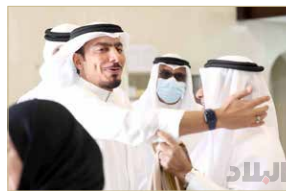
حديث باسم نيم وزير المجلسين والنائب حمد الكوحي بعد الجلسة

البوعيين ردا على سلمان: لست مسؤولاً عن جهاز الخدمة المدنية