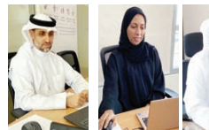
جانب من اللقاء التعريفي للمؤسسة الملكية.