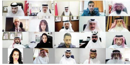
محافظ الجنوبية خلال الاجتماع.

ترأس سمو الشيخ خليفة بن علي بن خليفة آل خليفة محافظ المحافظة الجنوبية، اجتماع المجلس التنفيذي، المعاصر في دورته الثالثة للعام ٢٠٢١، وذلك عبر تقنية الاتصال المرئي، بحضور العميد عيسى ناصر الدوسري نائب المحافظ وعدد من الأعضاء من مختلف الجهات الحكومية المختلفة. وفي مستهل الاجتماع رحب سمو المحافظ بالحضور مؤكدا حرص المجلس التنفيذي وسعيه المستمر في تطوير القطاع الخدمي والتنموي، الذي يحظى بتوجهات ورعاية كريمة من قبل حضرة صاحب آل خليفة عاهل البلاد المقدي، ومتابعة صاحب السمو الملكي الأمير سلمان بن حمد آل خليفة، ولي العهد رئيس مجلس الوزراء، منوها سموه إلى عمل المحافظة الموثوق نحو متابعة تنفيذ وتحسين جودة الخدمات المقدمة للمواطنين والمقيمين بالتعاون مع مختلف الجهات المختصة.