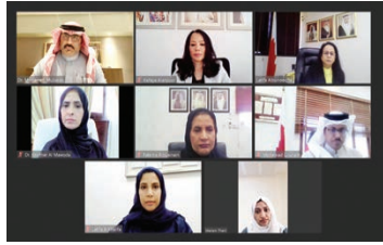
اجتماع لجنة تظلمات التربية.